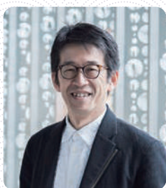
建築家 東京大学大学院教授

徳川宗家19代当主。翻訳家、政治経済評論家としても活動し、公益財団法人徳川記念財団理事長を務める。