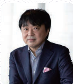
コピーライター 湘南ストーリーブランディング研究所代表